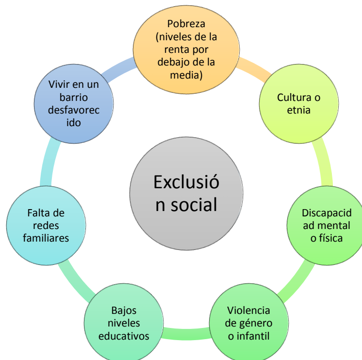
Figura 1. Factores de riesgo que influyen en la exclusión social

Sabiendo que el término es complejo, y que al final el resultado es probabilista, las decisiones o medidas para evitar sus causas se deben basar en los factores de riesgo que tienen mayor incidencia. Para una mayor comprensión se presenta la Figura 1 que explica la relación de estos factores.