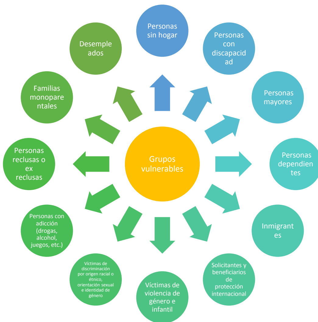
Figura 3. Principales colectivos en riesgo de exclusión social

Los colectivos en riesgo o más vulnerables requieren una atención y medidas específicas para combatir la exclusión social. En la Figura 3 se representan los principales colectivos en riesgo identificados.